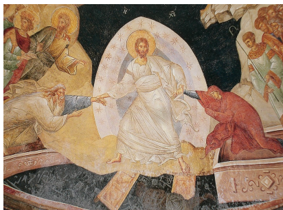
L'Anastasis (Résurrection) Fresque de l'église Saint-Sauveur-in-Chora, Turquie.

Que notre mission en Équipe réponde à ton appel dans la joie de te servir !