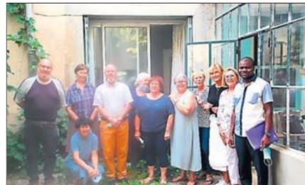
La solide équipe du comité paroissial.