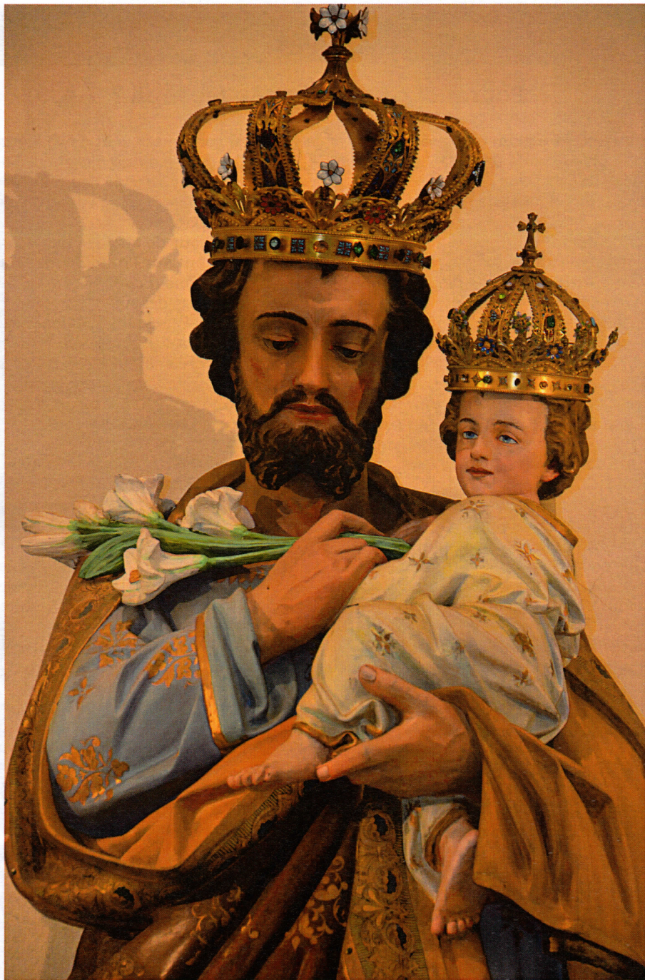
Saint Joseph. Statue du sanctuaire des Pères Spiritains à ALLEX (Drôme)