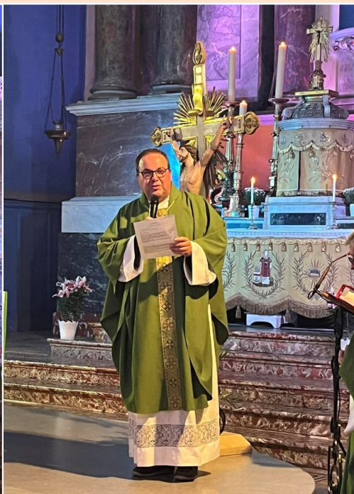
La messe pontificale d'INSTALLATION en l'église de SIGEAN, le 17 septembre.