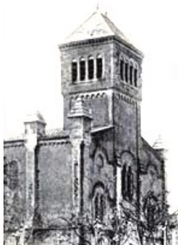
Eglise de PORT-la-NOUVELLE