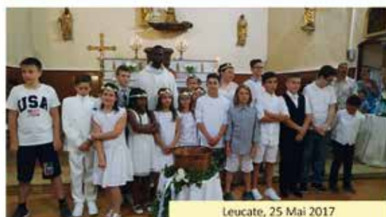
Leucate, 25 Mai 2017