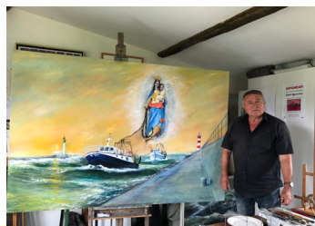
140 ans de la Consécration de Notre Dame de Bon Voyage Port-La-Nouvelle 10 Juillet 2017