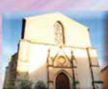
Église Saint Martin Place de l'Église 11540 Roquefort-des-Corbières