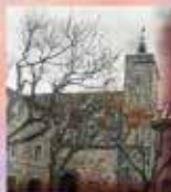
Église Saint Paul Place de la Mairie 11440 Peyriac-de-Mer