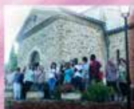
Notre Dame Rue de l'Église 11510 Feuilla