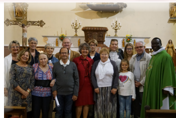
Leucate Répétitions : Église, mercredi 18 h