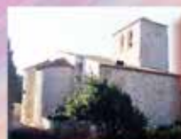
Église St Julien et Ste Basille Le Bourg 11510 Fitou