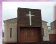
Chapelle Saint Pierre Chemin du Mouret 11370 Leucate Plage