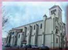
Notre Dame de Bon Voyage Passage de l'Abbé Gavanon 11210 Port-La-Nouvelle