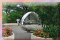
Notre Dame de la Mer Rue du Cap des 3 Frères 11370 La Franqui