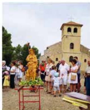
Fête de la Saint Roch, Saint Martin, Roquefort-des-Corbières 16 Août 2017

Les rencontres se tiennent le jeudi de 14h à 16h30, une fois par mois.