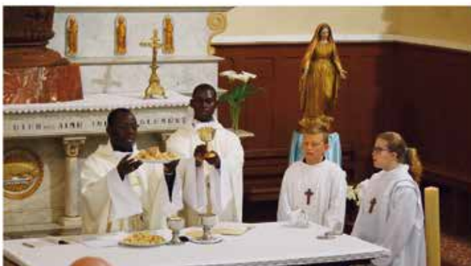
Sainte Cène, Leucate 13 Avril 2017