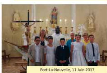
Port-La-Nouvelle, 11 Juin 2017