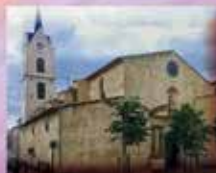
Notre Dame de l'Assomption Place de l'Église 11370 Leucate Village