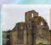
Notre Dame des Oubiels 43° 3' 6.84" N, 2° 54' 43.2" E