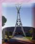
Église Saint Jacques Avenue de Septimanie 11370 Port-Leucate