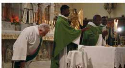
Messe d'Accueil, Bages, 18 Novembre 2017