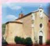
Église Ste Germaine 20, Avenue de la Mer 11510 Caves