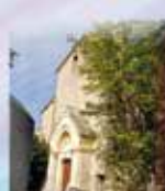
Notre Dame de l'Assomption Rue de l'Église