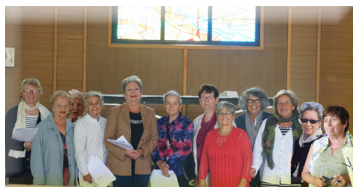
Port-Leucate Répétitions : Église, vendredi 15 h