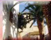
Église Saint Jean 1, Place Saint Jean