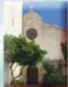
Église Saint André Rue de l'Église 11510 Treilles

Les églises de Caves, Leucate, Port-Leucate, La Palme, Portel, Port-La-Nouvelle et Sigean, sont ouvertes tous les jours de l'année (fermeture entre 12h et 14h, ainsi que le dimanche après-midi).