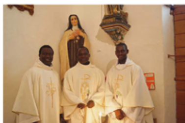
Fête de l'Épiphanie, Feuilla