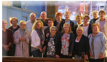
Port-La-Nouvelle, Sigean Répétitions : Sigean, mercredi 17h30