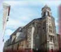
Église Saint Félix Place de la Libération 11130 Sigean