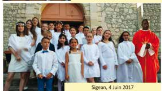
Sigean, 4 Juin 2017