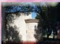
Chapelle Saint Pancrace Rond-point de La Palme