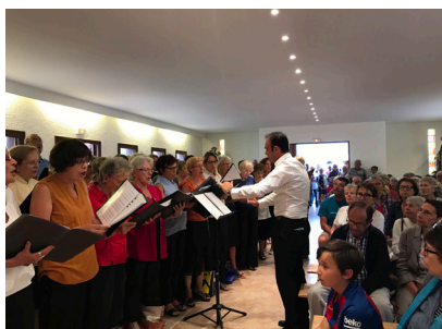
Fête de la Saint Pierre, Leucate Plage,