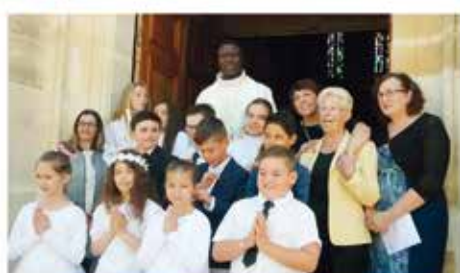
Roquefort-des-Corbières, 28 Mai 2017