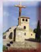
Chapelle Saint Martin au-dessus du village