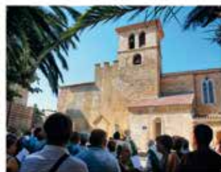
Bénédiction des nouvelles cloches de l'Eglise Saint Jean par Monseigneur PLANET,