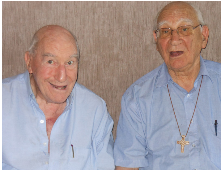
Image de la Grand Croix Mariale Eucharistique et Trinitaire des frères Jaccard.

Le site web pour en savoir plus sur eux : www.freresjaccard.org